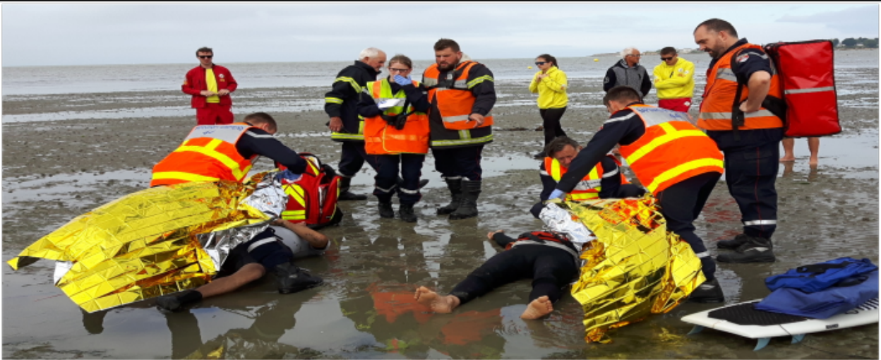
Voix Off: Le froid se fait sentir, allez hop méthode papillote.