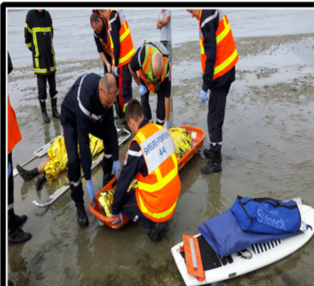
Voix Off: et empaqueté...