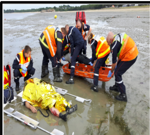
Pompier: à mon signal on lève !!!