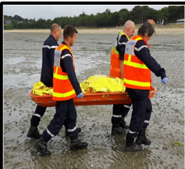
Voix Off: Un de sauvé !!!