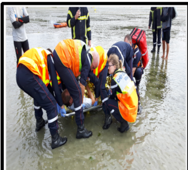
Pompier: à mon signal on lève !!!