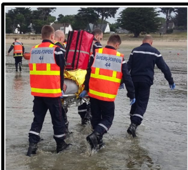
Voix Off: et de deux !!!