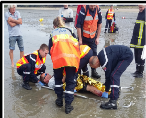
Voix Off: On repète la manoeuvre.