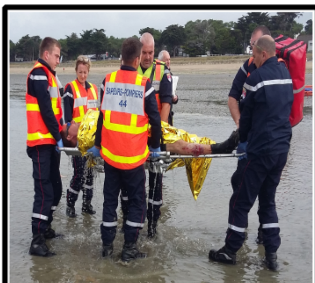
Voix Off: Go pour l'évacuation.