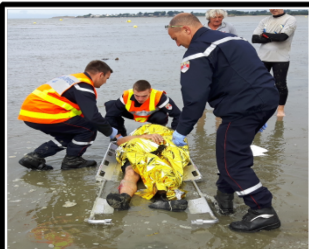
Voix Off: La marée monte, on va avoir un noyer.