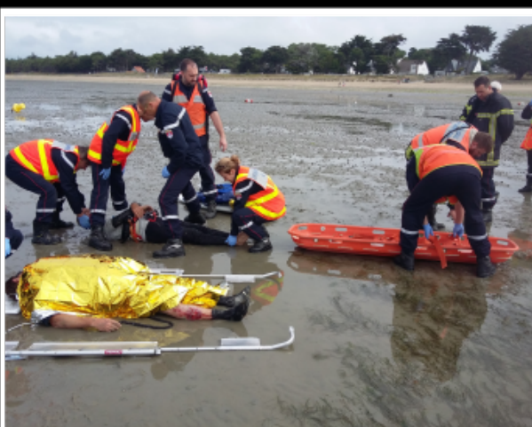
Voix Off: Tout le monde se prépare.